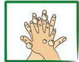
Vryf die agterkante van elke hand en tussen die vingers