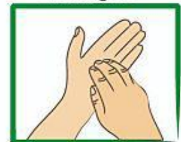
Vryf die punte van die vingers