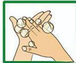
Vryf palms teen mekaar