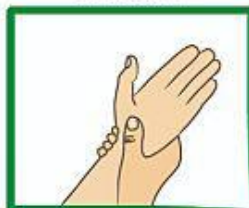
Vryf elke pols met ander hand