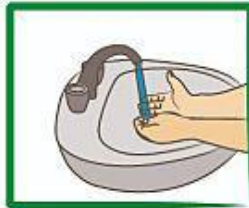
Maak hande nat met water