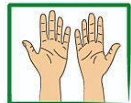
Jou hande is nou skoon.

Die Corona virus gaan nog lank beveg moet word. Die mediese personeel werk hard daaraan om 'n behandeling te ontwikkel. In hierdie tyd moet ons aanhou om onself en ander veilig te hou deur die masker te dra en sosiale afstand tussen ons en ander te hou.