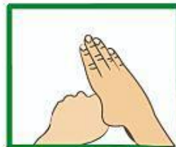
Vryf elke duim met gevuisde hand