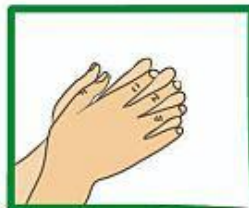
Vryf palms teen mekaar en vingers inmekaar