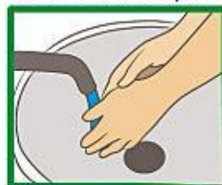
Spoel hande af met water