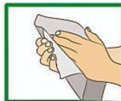
Droog hande binne, buite en tussen die vingers af